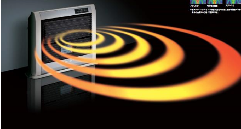
石油ファンヒーター

WZシリーズ 3年保証 コロナファンヒーターの新フラッグシップモデル、WZシリーズが誕生しました。